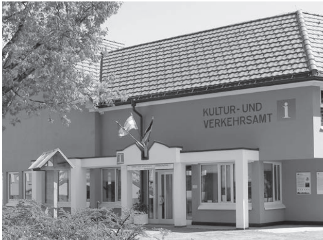
Geschäftsstelle der VHS Wehr, Hauptstraße 14